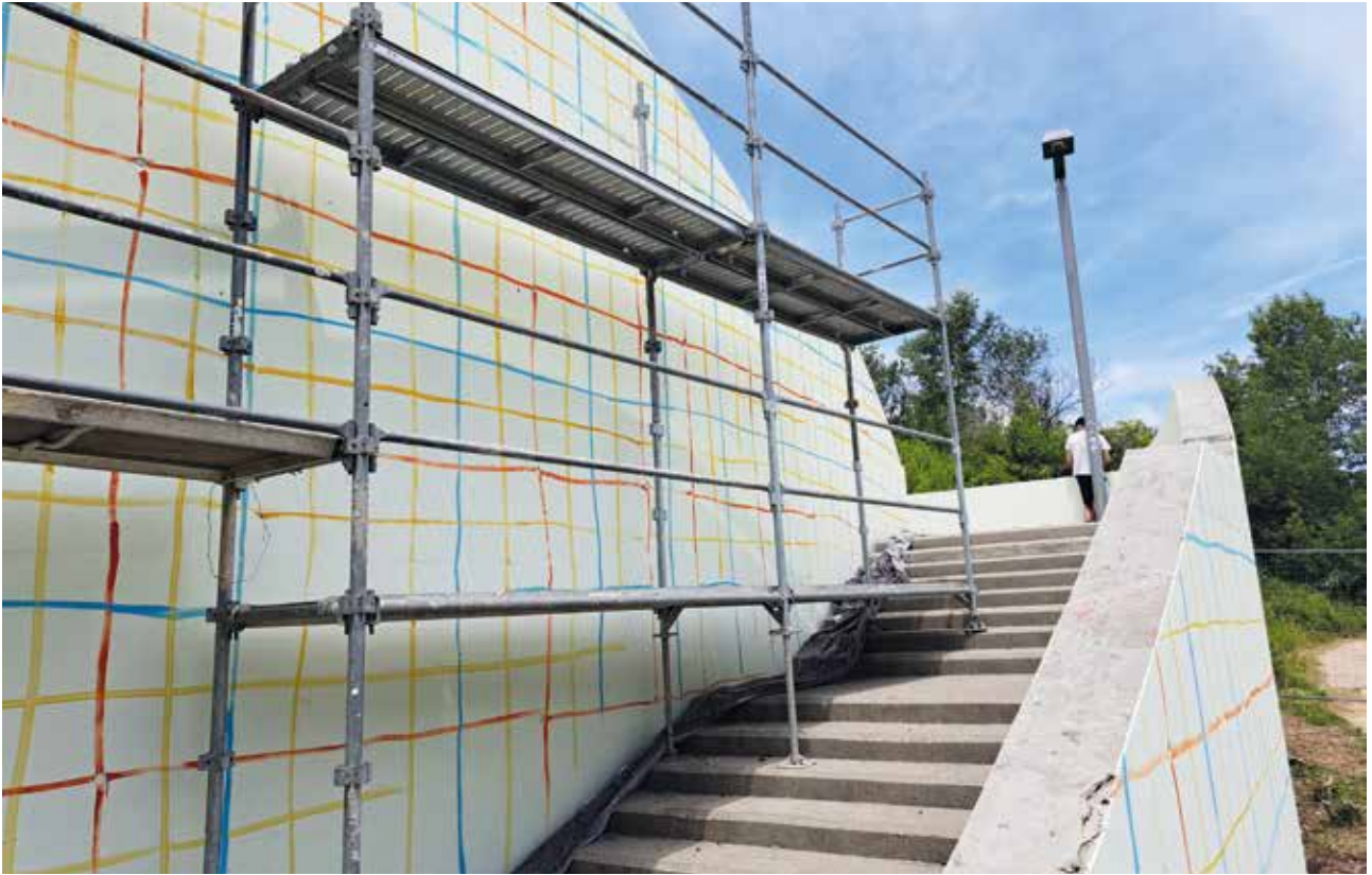
Les murs des escaliers de la Réserve 2000 en préparation avant la peinture.