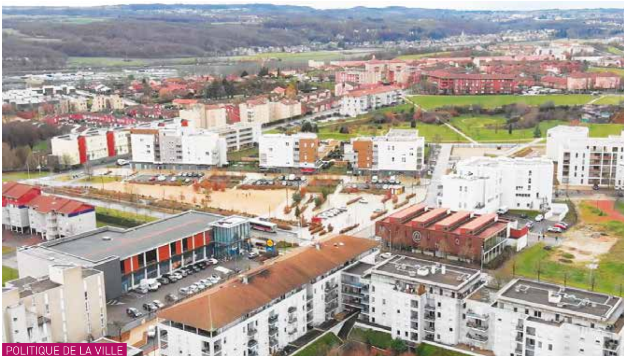
POLITIQUE DE LA VILLE